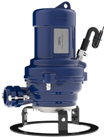
ORCUT TMS mit Standfuß ORCUT TMS with stand plate